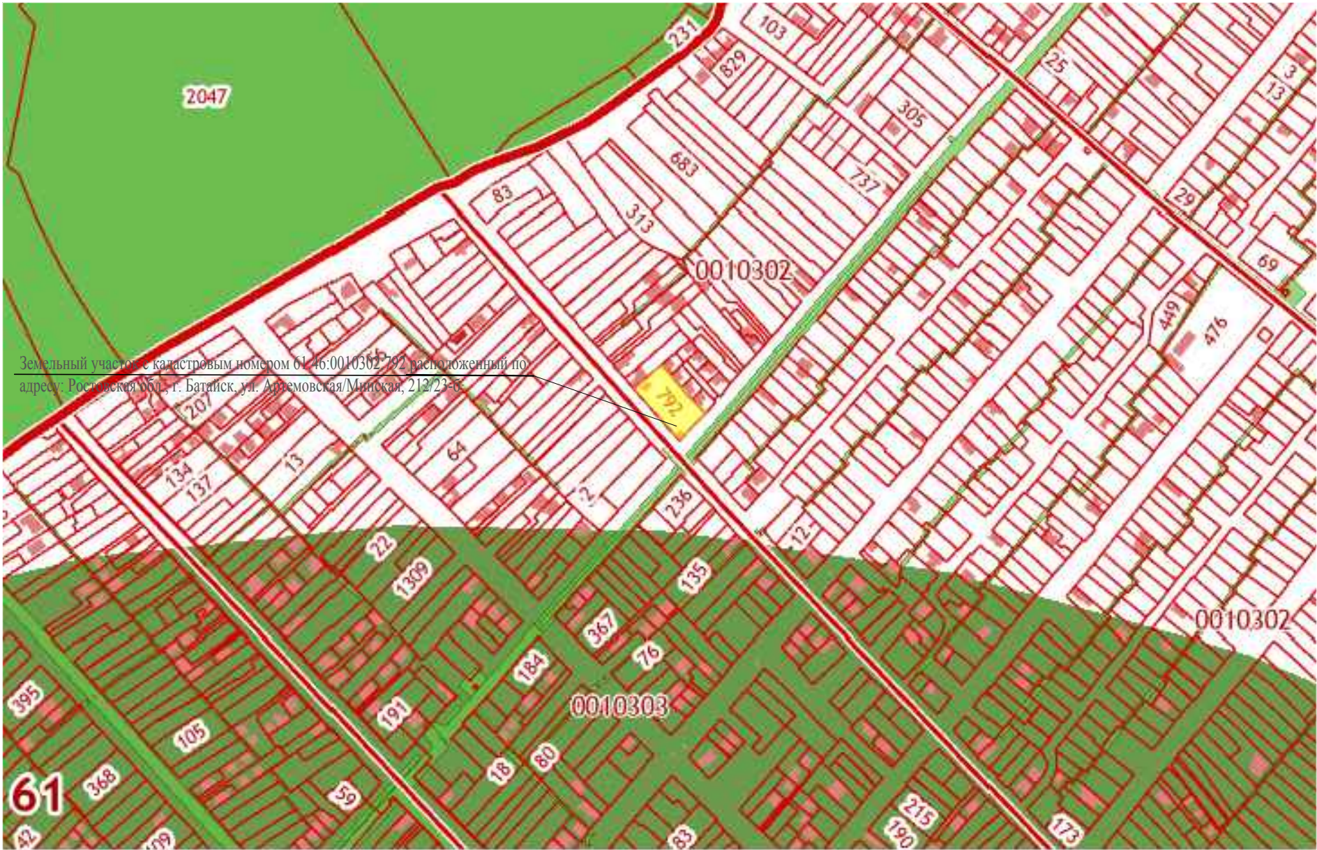
Земельный участок с кадастровым номером 61:46:0010302:792 расположенный по адресу: Ростовская обл., г. Батайск, ул. Артемовская/Минская, 212/23-б

В соответствии с ПЗЗ, утвержденным проектируемая территория расположена в зоне с особыми условиями использования территории, а именно в границах приаэродромных территорий "Аэродром экспериментальной авиации Ростов-на-Дону «Северный» (Решение об установлении приаэродромной территории аэродрома экспериментальной авиации, город Батайск" ( см. Воздушный кодекс РФ, постановление Правительства Российской Федерации №138 "Об утверждении Федеральных правил использования воздушного пространства Российской Федерации").